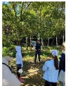
成長する「はじまりの森」の様子を聞く