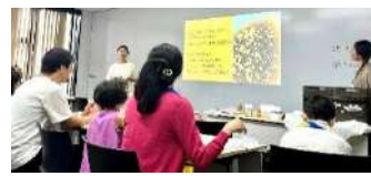
サマセミ感謝祭にて

一匹一匹の知能は高くないのに集団の知性の高さがすごいんです。人間社会よりも先行してると言われています。